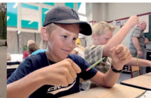
Wie de jeugd heeft...