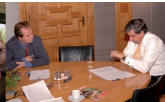
Op bezoek bij de minister