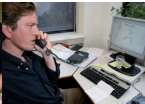
kennis & informatie