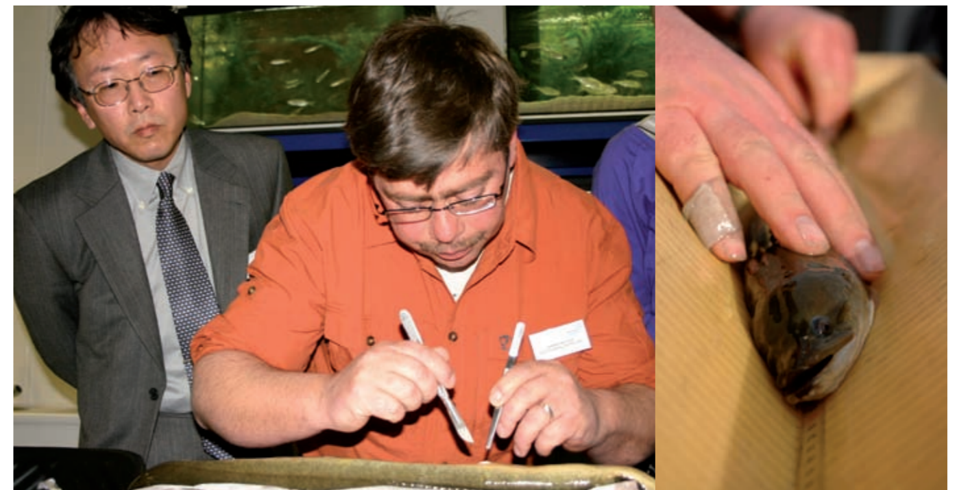
Internationale workshop aal

De uitzonderlijke slechte situatie van de Europese aal was ook aanleiding voor het opstellen van het Nederlands Beheerplan Aal. Met dit beheerplan, dat Sportvisserij Nederland in samenwerking met de beroepsvisserij, Wageningen Universiteit en verschillende natuurorganisaties heeft opgesteld, is een eerste aanzet gegeven het tij voor deze bedreigde vissoort te keren.