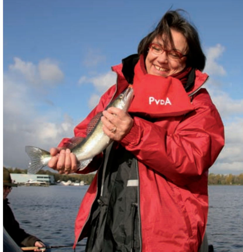
Voorzitter van de Tweede Kamer, Gerdi Verbeet ging een dagje mee snoekbaarzen.

Het beheer van het water, de leefomgeving van vissen, valt onder de verantwoordelijkheid van de waterbeheerder. Een goede samenwerking tussen sportvisserij, waterbeheerders en beroepsvisserij is de belangrijkste voorwaarde voor een gezonde en aantrekkelijke visstand, maar vormt ook de basis voor een breed gedragen water- en visstandbeheer. Deze samenwerking vindt plaats in visstandbeheercommissies, in de praktijk meestal afgekort als VBC's. Voor de meeste watersystemen waren in 2006 VBC's ingesteld. Via directe ondersteuning maar