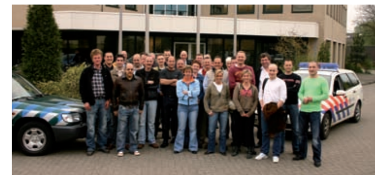
Cursus Controle Visdocumenten

Bijzondere aandacht verdient tenslotte het project dat in 2005 onder de noemer Punt Uit van start is gegaan. Dit project richt zich op leerlingen van basisscholen en bestond uit een instructievideo en een internetsite. Zowel de video als de site had tot doel de jeugd kennis te laten maken met de sportvisserij en de wonderde wereld onder water. Punt Uit kreeg een vervolg in de vorm van een speciaal lesprogramma waar basisscholen zich voor kunnen inschrijven. Ruim 500 scholen hebben zich inmiddels ingeschreven voor een les over vis, visstand en sportvisserij. In 2006 ondersteunde Sportvisserij Nederland diverse federaties en verenigingen bij het geven van de vislessen. In het verlengde hiervan is begonnen met het ontwikkelen van de cursus Vismeester, waarin het organiseren en geven van vislessen op basisscholen centraal staat.