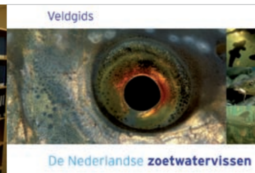
Determinatiegids de Nederlandse zoetwatervissen