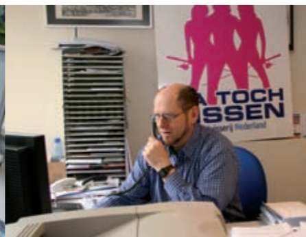
visdocumenten & controle