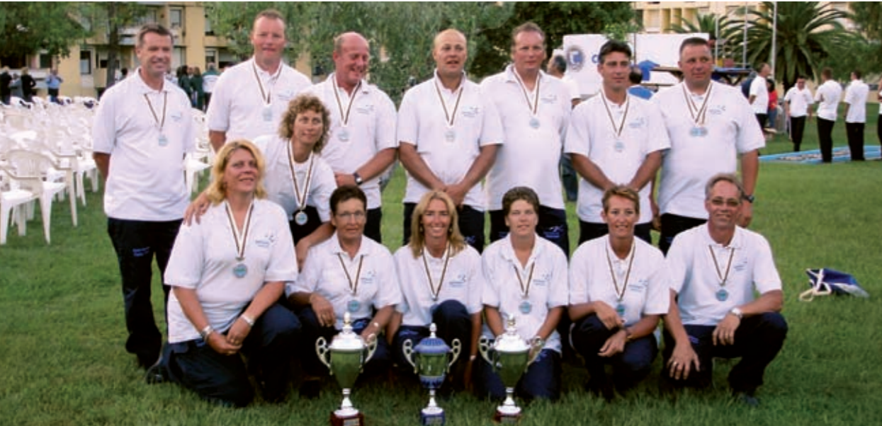
Zowel het Nederlandse Heren, Damesteam en de Junioren (niet op foto) behoren met hun 2e plek op het WK Kust bij de absolute wereldtop.

Het resultaat mag er zijn. Vanaf 1 januari 2007 gaan sportvissers met de VISpas en de bijbehorende Lijsten van Viswateren naar de waterkant.