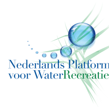
Sportvisserij Nederland als recreatieorganisatie

Ook de zee is voor de sportvisserij van groot belang. Vooral in de zomerperiode wordt er door honderdduizenden mannen, vrouwen en kinderen veel plezier beleefd aan een dagje vissen op of aan zee. Een goede visstand en een duurzame visserij zijn hiertoe essentieel. Sportvisserij Nederland heeft een directe invloed op het gemeenschappelijke visserijbeleid van de Europese Unie door dat zij is vertegenwoordigd in de RAC Noordzee en de RAC pelagische vissoorten. De RAC's bestaan uit vissers, wetenschappers en milieuorganisaties. De RAC's worden door de Europese Commissie geraadpleegd over voorstellen voor maatregelen zoals herstel- of beheerplannen. Verder kunnen RAC's zelf advies