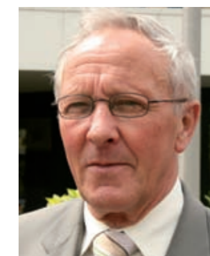
Nol Sweep Voorzitter

Wat betreft de toekomst van de sportvisserij kunnen we gerust stellen dat het gezegde "wie de jeugd heeft, heeft de toekomst" van toepassing is. De Nederlandse jeugd vist namelijk massaal. Uit recent onderzoek blijkt dat meer dan 550.000 kinderen vissen en dat dit aantal blijft groeien. Jongens en steeds meer meisjes die op een spannende manier in contact met de natuur komen. Een imposant stuwmeer van sportvissers, nieuwe vrijwilligers en bestuurders. Ook dankzij die jeugd zien we de toekomst van de sportvisserij met een stevig vertrouwen tegemoet.