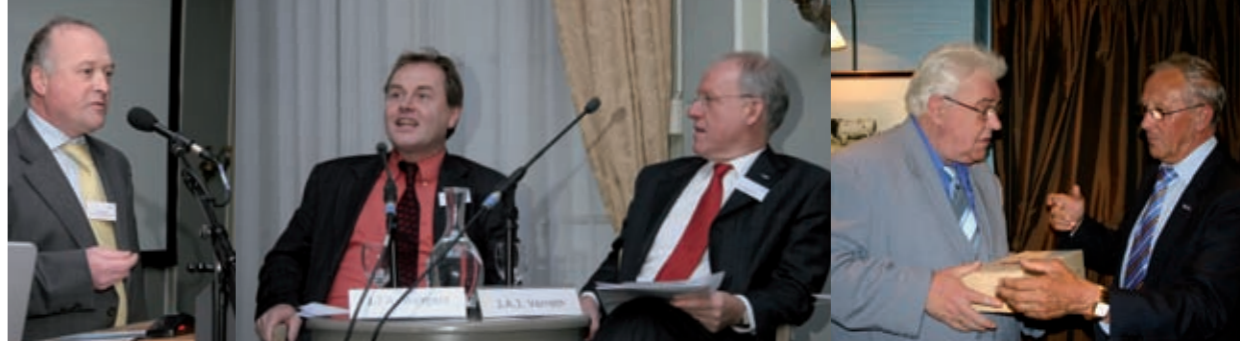
100 jaar georganiseerde sportvisserij Ledenvergadering

Ledenvergadering De eerste Algemene Ledenvergadering van Sportvisserij Nederland werd op 17 juni 2006 in De Bilt gehouden. Aan de orde kwamen de versterking van de organisatie, de jaarstukken van de NVVS en OVB, de stand van zaken bij Sportvisserij Nederland