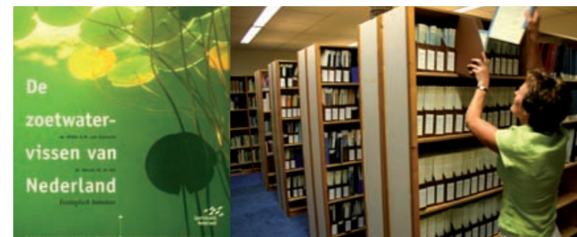
De zoetwatervissen van Nederland - ecologisch bekeken

Door samenvoeging van de bibliotheken van de NVVS en OVB beschikt Sportvisserij Nederland over een unieke collectie visgerelateerde boeken en wetenschappelijke tijdschriften. De bibliotheek is één van de grootste van Europa op het gebied van visserijbiologie en aanverwante onderwerpen. Naast boeken, tijdschriften, overdrukken etc.