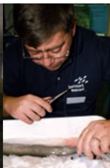
advisering & begeleiding