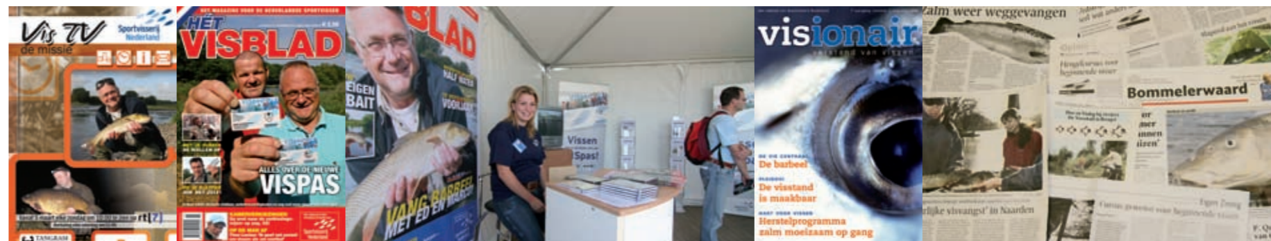
Sportvissen op TV

Beurzen worden beschouwd als een van de oudste communicatiemiddelen. Al in de Romeinse tijd presenteerden handelaren hun koopwaar gemeenschappelijk op een vaste locatie. Voor Sportvisserij Nederland betekent de aanwezigheid op beurzen een ideale mogelijkheid om persoonlijk met sportvissers te communiceren. In 2006 presenteerde Sportvisserij Nederland zich op diverse landelijke en regionale publieksbeurzen. Naast de landelijke hengelsportbeurs de Visma, was Sportvisserij Nederland aanwezig op Carp 2006, een zeer druk bezochte beurs voor karpervissers, de regionale beurzen in Utrecht en Groningen, de Fair for Lure & Fly en tevens op de 50 + beurs. 50 plussers beschikken over veel vrije tijd en de sportvisserij vormt voor velen van hen een potentiële besteding van die vrije tijd.