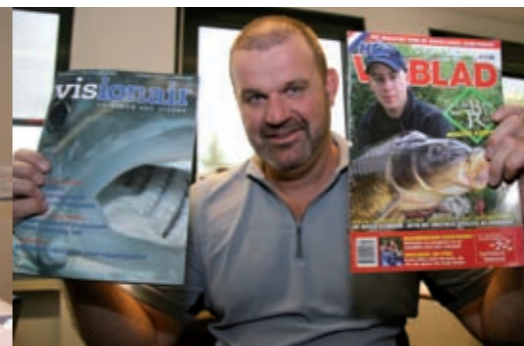
communicatie en educatie