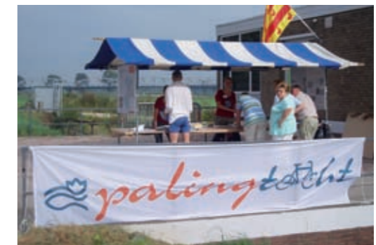
Samenwerken met natuur- en milieuorganisaties