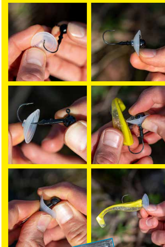
De M-versie (2 cm) is geschikt voor jigkoppen tot 10 à 12 gram en soft plastics van een centimeter of 10. Vis je zwaarder en/of groter, dan is de L-uitvoering (3 cm) beter geschikt.

De Cup-rig steekt wat uit bij een jigkop, maar dat hoeft de inhaking niet negatief te beïnvloeden. Zorg er wel voor dat de lengte van de haaksteel niet te kort is, zodat er voldoende afstand zit tussen de rand van de cup en de haakpunt. Prik de soft plastic ook zo op de haak dat de bocht ruim boven de het lijf uitsteekt. Monteer de cup tenslotte als parachute zodat de ring verder verwijderd zit van de haakpunt.