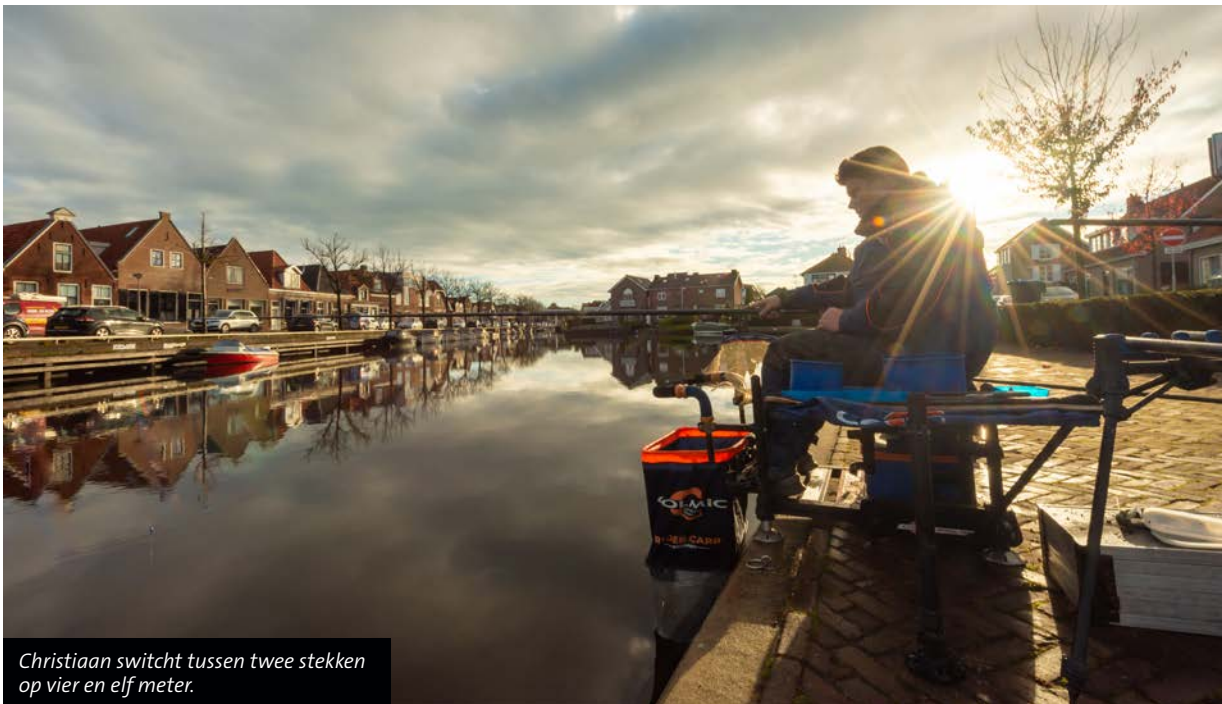
Christiaan switcht tussen twee stekken op vier en elf meter.

bij aanbeten, dan geeft een stukje onderlijn plat op de bodem de vis extra ruimte en tijd om het aas wel goed te pakken. Hiervoor schuif je de dobber zo'n vijf tot tien centimeter naar boven", strooit Christiaan met tips. In de tussentijd resulteert elke inzet van hem in een aanbeet. Soms slaat hij mis, maar in de regel zijn mooie blankvoorns van gemiddeld zo tussen de 10 en 15 centimeter de klos.