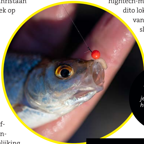
Met spaghetti balletjes hoef je niet telkens de haak opnieuw te beazen.

sommige wateren kan je door (geknipte) wormen te voeren – en die ook als haakaas te gebruiken – mooie baarsvangsten met de vaste hengel realiseren. De truc om alvers en kleine roofbleitjes te vangen is door deze te lokken met klein, los aas. Die vang je daarna met name goed boven de bodem, maar soms ook slechts enkele decimeters onder het wateroppervlak." Na een indrukwekkend aantal blankvoorns is het wel duidelijk dat er ook in de winter mooie witvisvangsten mogelijk zijn. "Kies je de juiste stek, dan heb je bovendien geen hightech-materiaal, ingewikkelde montages en dito lokvoer nodig. En doordat je veel vis vangt, blijf je nog eens warm ook", besluit Christiaan.