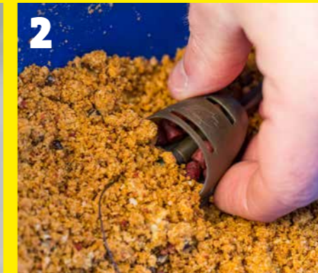
2 Vul hem daarna af met grondvoer.