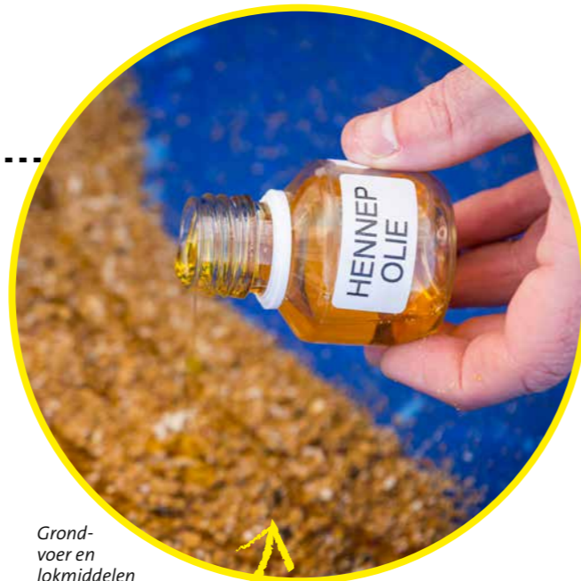
Grondvoer en lokmiddelen zoals hennep-olie geven een mooi spoor af.

De visuele prikkel van een opvallend gekleurd aasje heeft – afhankelijk van de helderheid van het water – een vrij beperkt bereik. Zeker in troebel water is het daarom verstandig om met één hengel en een method- of pelletfeeder ook nog een geurspoor te creëren. Dat kan met een vloeistof of hele kleine voedseldeeltjes zoals grondvoer. Daarbij zullen oliën zich vooral in verticale richting verspreiden en (boilie)dips meer horizontaal uitwasemen. “Op ondiepe wateren heeft een horizontaal bewegend voerspoor meer effect, maar daarbij is dan ook wel een beetje wind, een lichte trek of onderstroming vereist”, zegt Corné die zelf graag hennep-olie toevoegt aan zijn voer.