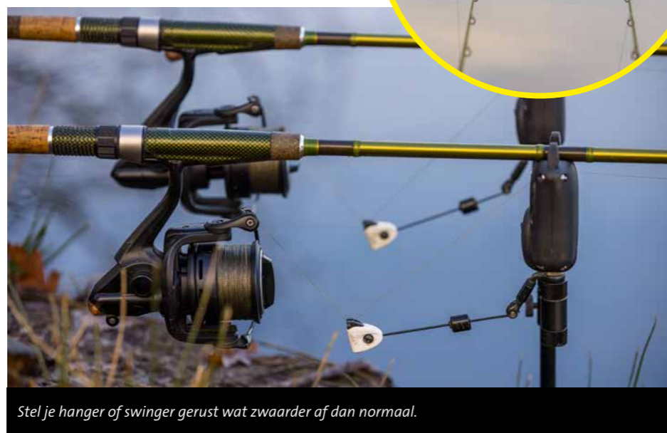
Stel je hanger of swinger gerust wat zwaarder af dan normaal.

Zorg dat je lijn het topoog recht verlaat voor een maximale beet- en lijnzwemmer-registratie.