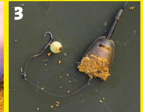
3 Stem de kleefkracht van je grondvoer af op de omstandigheden.