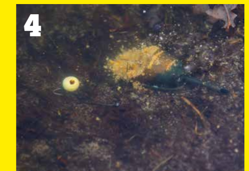
4 Grondvoer is een perfect transportmiddel voor vloeibare lokmiddelen, maar heeft van zichzelf ook een lokkende werking.

Corné vult zijn inline model pelletfeeder eerst met wat grotere voedseldeeltjes en sluit deze daarna op met grondvoer. Dit laatste zorgt er voor dat de voedseldeeltjes tijdens de worp netjes in de pelletfeeder blijven zitten, maar heeft zelf ook een lokkende werking. Bovendien is het grondvoer een perfect transportmiddel voor liquids en boosters. “Gebruik je relatief droog grondvoer met weinig kleefkracht, dan komt dit onder water snel los uit de pelletfeeder en geeft het snel een voedselsignaal af. Dat is ideaal voor gebruik op stilstaand water”, licht Corné toe. “Staat er echter wat trek op het water, dan is dat effect snel uitgewerkt. Daarom geniet in dat geval wat natter voer met meer kleefkracht de voorkeur: dit heeft meer weg van deeg, is taaiër en biedt een langdurigere lokkende werking.”