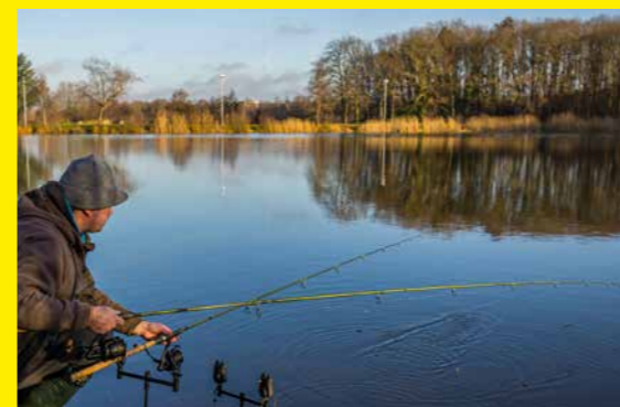
Bij het 'haasje over' ingooien werp je om de vijf minuten in en wisselen de hengels op de steunen telkens van positie.

aasje werkt hiervoor uitstekend. Denk aan een fluo-pop up, fluo-wafer of een knalgeel of roze nep-maisje bovenop je mini-boilie. Op troebel water moet dat aas niet te ver boven de bodem staan. Dus dan pak ik altijd een waferdje dat net boven de haak zweeft maar wel zinkt op het haakgewicht."